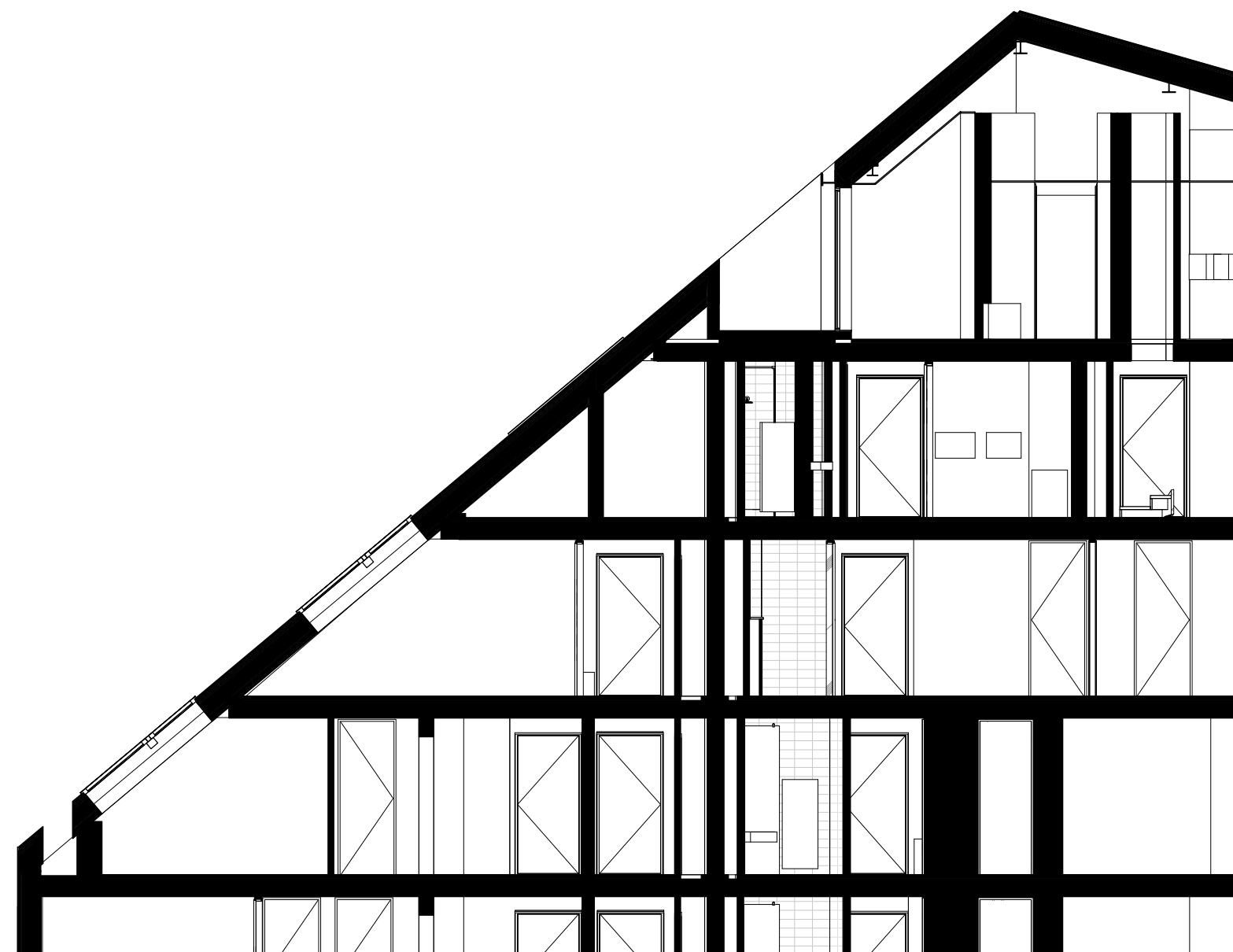
Bouwdeel A doorsnede